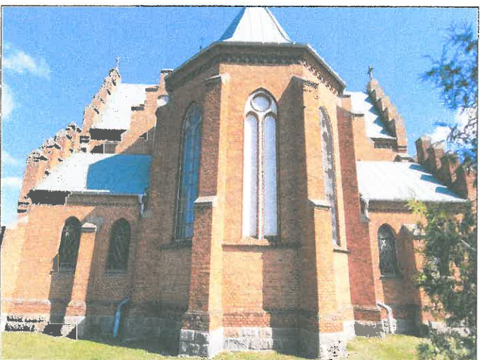
FOT.15 ELEWACJA POŁUDNIOWA.