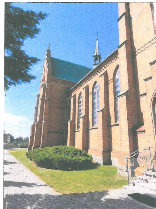
FOT.19 ELEWACJA WSCHODNIA.