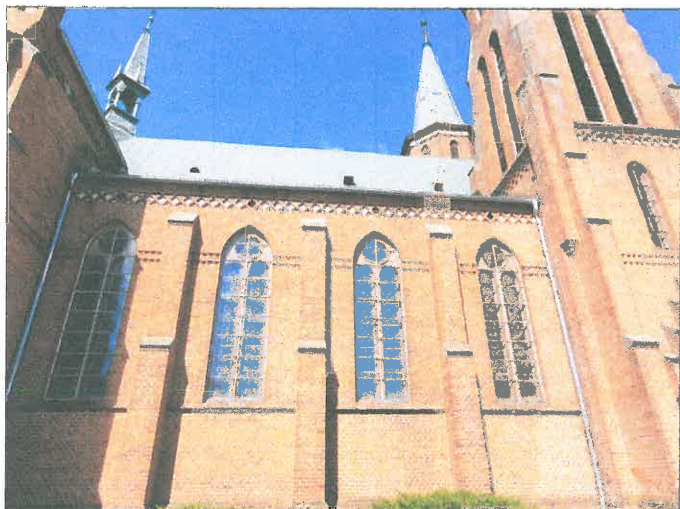
FOT.17 ELEWACJA WSCHODNIA.