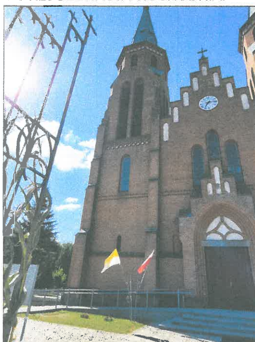
FOT.21 ELEWACJA PÓŁNOCNA.