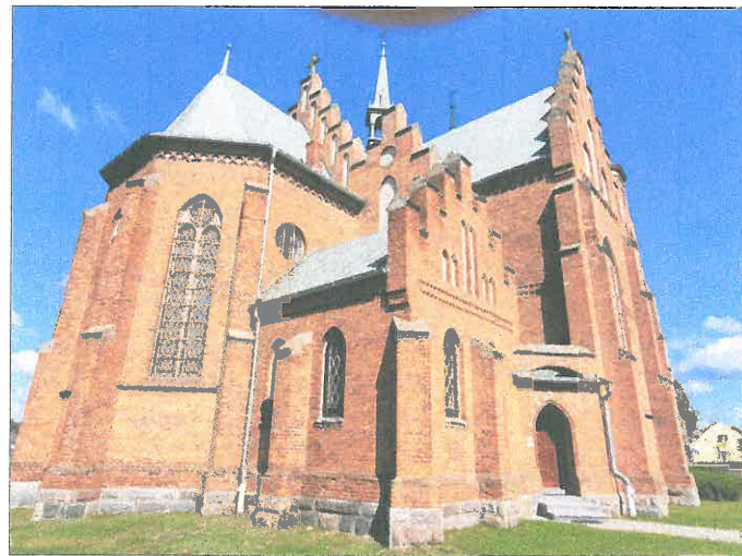
FOT.16 ELEWACJA POŁUDNIOWA.