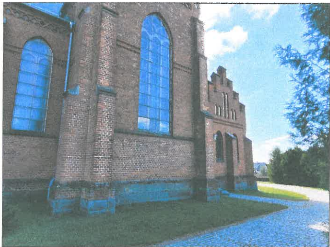
FOT.14 ELEWACJA ZACHODNIA.