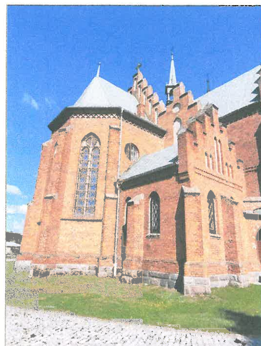
FOT.18 ELEWACJA WSCHODNIA.