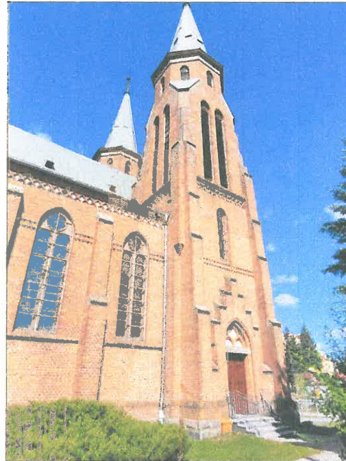
FOT.20 ELEWACJA WSCHODNIA.