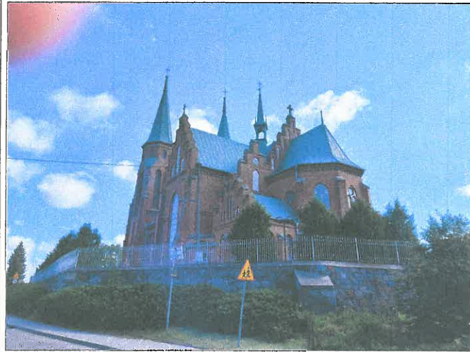
FOT.13 ELEWACJA POŁUDNIOWA.