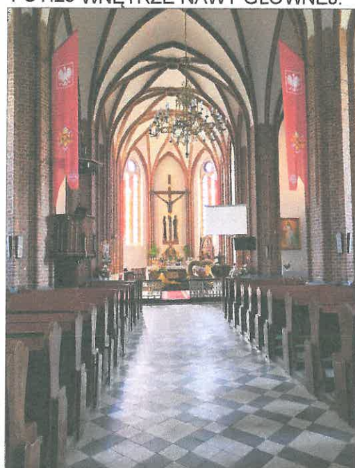
FOT.26 WNETRZE NAWY GLÓWNEJ.