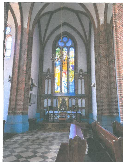
FOT.25 WNETRZE NAWY GLÓWNEJ.