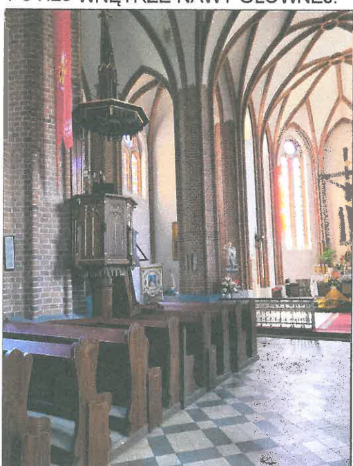
FOT.27 WNETRZE NAWY GLÓWNEJ.