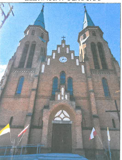
FOT.24 ELEWACJA PÓŁNOCNA.