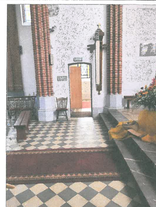
FOT.31 WNETRZE NAWY GLÓWNEJ.