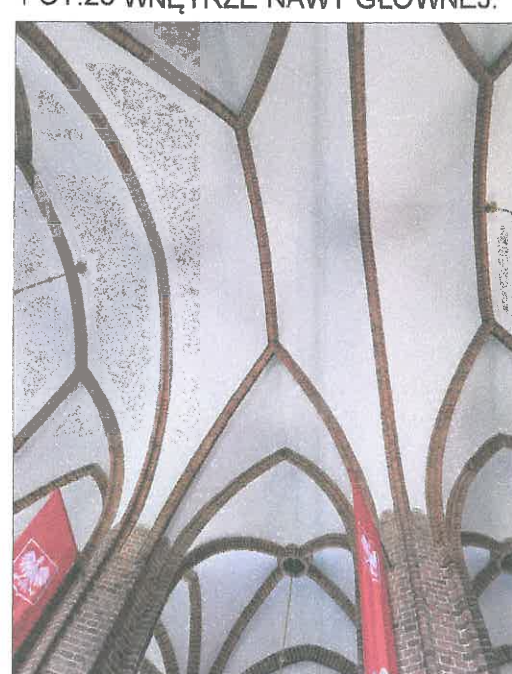
FOT.29 WNETRZE NAWY GLÓWNEJ.