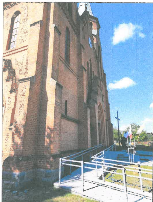
FOT.22 ELEWACJA PÓŁNOCNA.