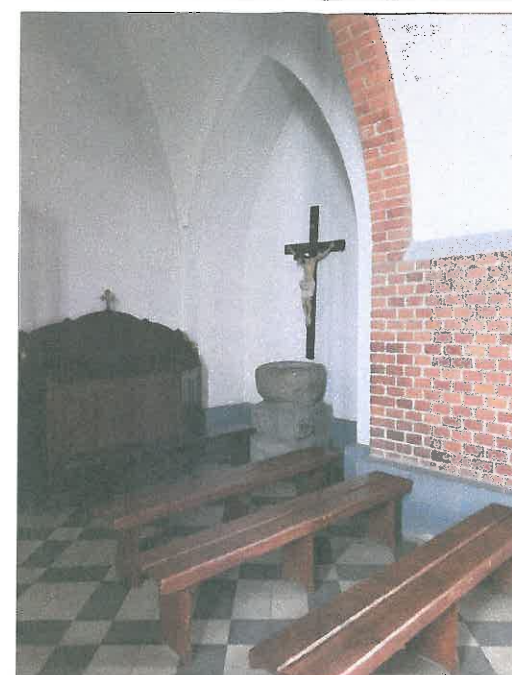
FOT.28 WNETRZE NAWY GLÓWNEJ.