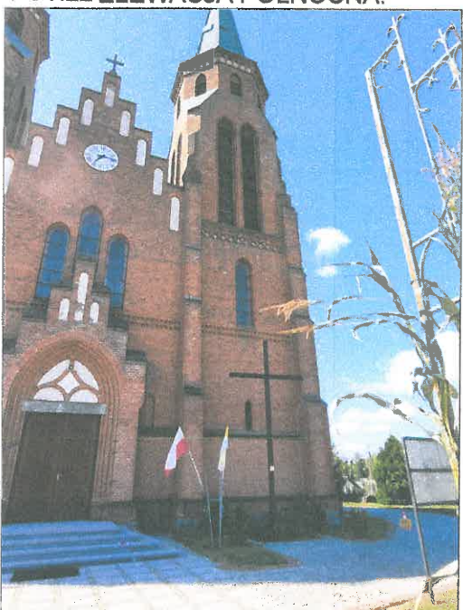
FOT.23 ELEWACJA PÓŁNOCNA.