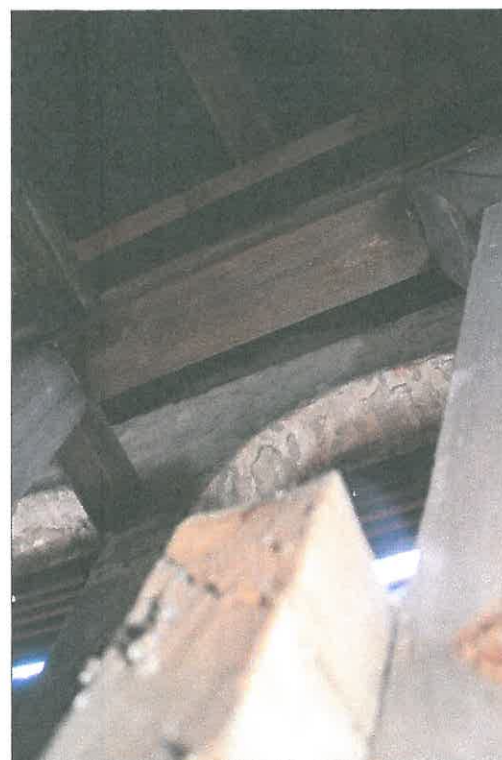
FOT. 30 Wieżba dachowa - wieża.