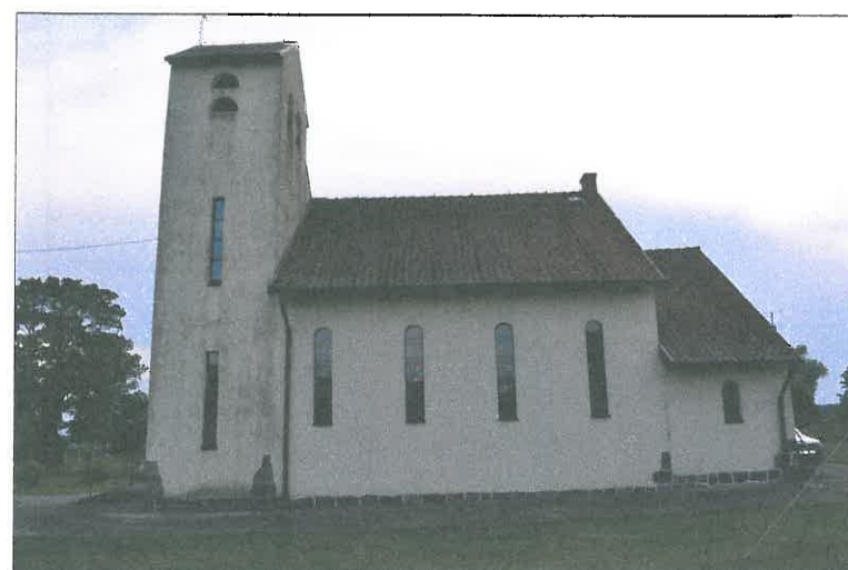
FOT. 3 Elewacja zachodnia obiektu.