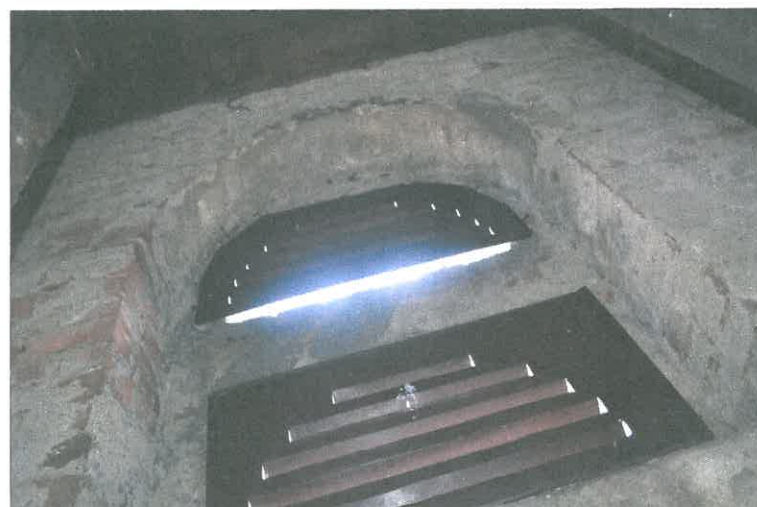
FOT. 31 Wieżba dachowa -wieża.

STAROSTWO POWIATOWE 13-100 Nidzica ul. Traugutta 23 tel. 22 66 11 00, 22 66 11 01