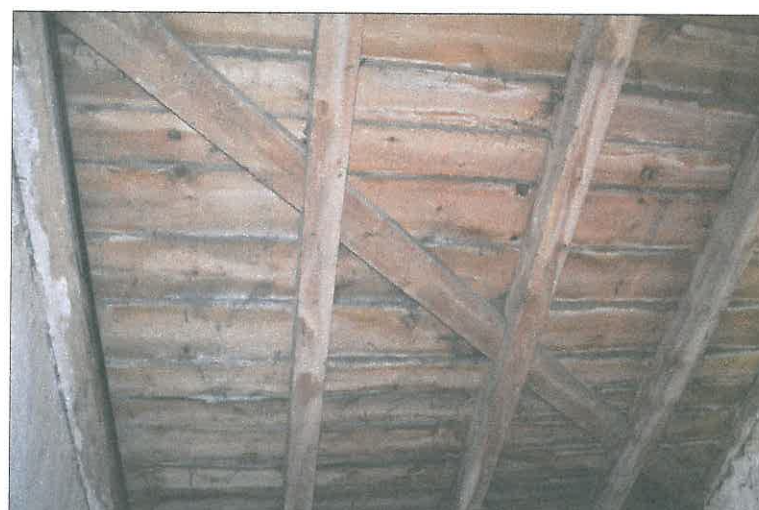
FOT. 13 Wieżba dachowa - prezbiterium.