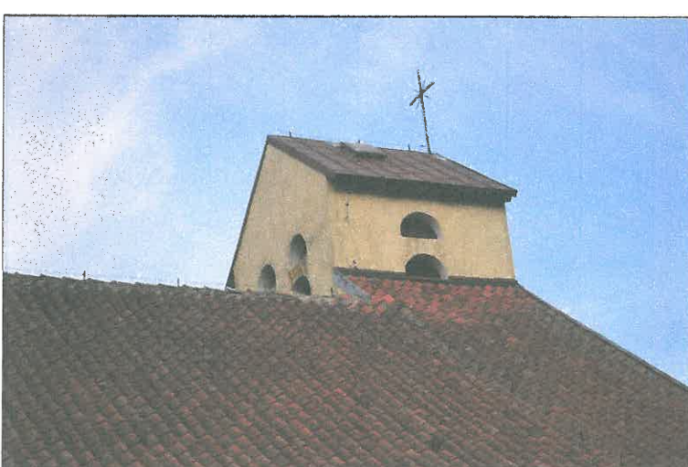
FOT. 8 Elewacja wschodnia obiektu.