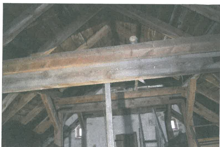
FOT. 19 Więźba dachowa - nawa główna.