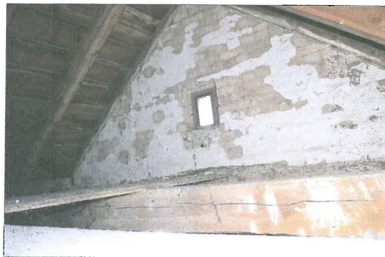
FOT. 9 Wieżba dachowa - prezbiterium.