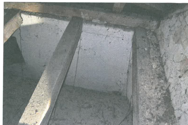
FOT. 10 Wieżba dachowa - prezbiterium.