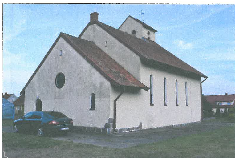
FOT. 5 Elewacja północna obiektu.