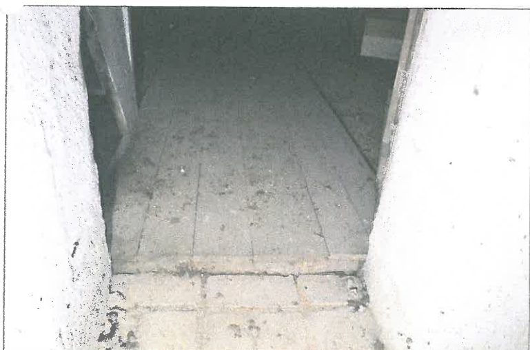
FOT. 15 Przejście między prezbiterium a nawą główną.