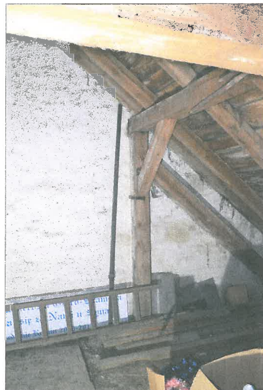
FOT. 27 Wieżba dachowa - nawa główna.