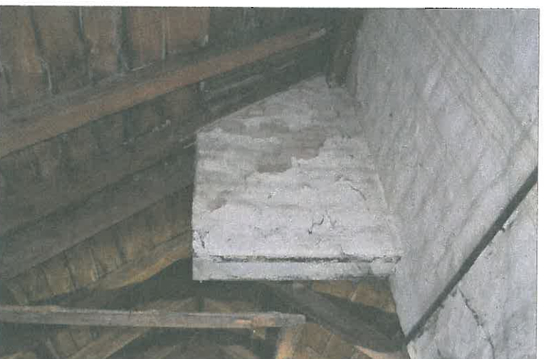
FOT. 25 Więźba dachowa - nawa główna.