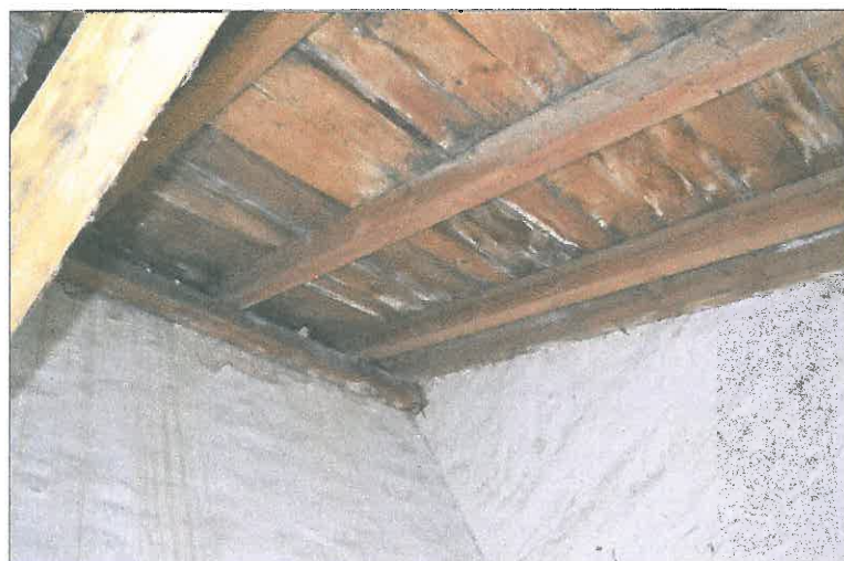
FOT. 28 Wieżba dachowa - nawa główna.