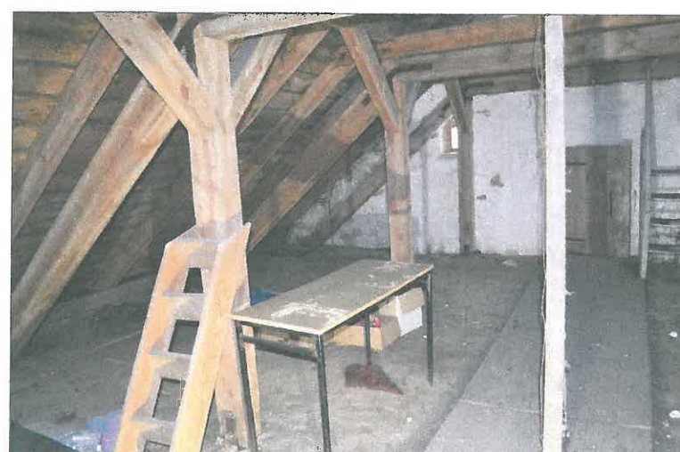
FOT. 16 Wieżba dachowa - nawa główna.