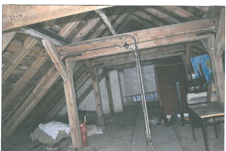
FOT. 20 Więźba dachowa - nawa główna.