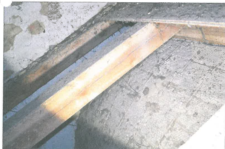
FOT. 12 Wieżba dachowa - prezbiterium.