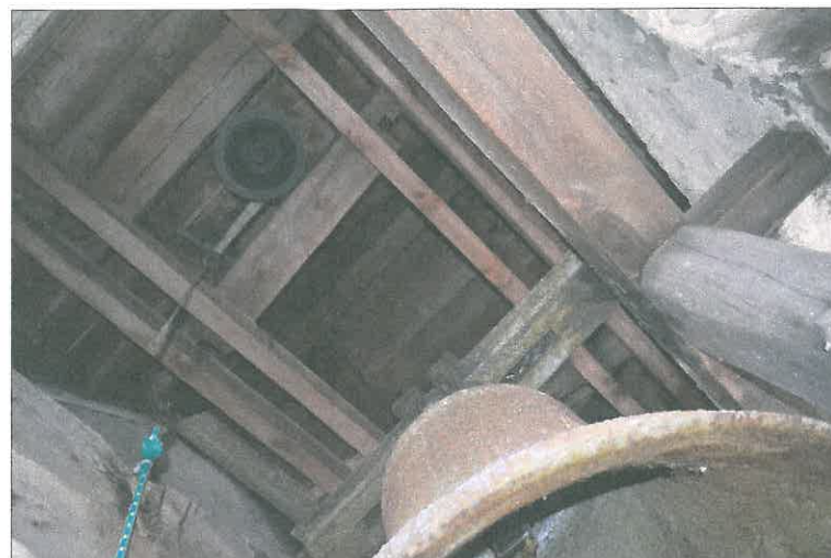
FOT. 29 Wieżba dachowa - wieża.