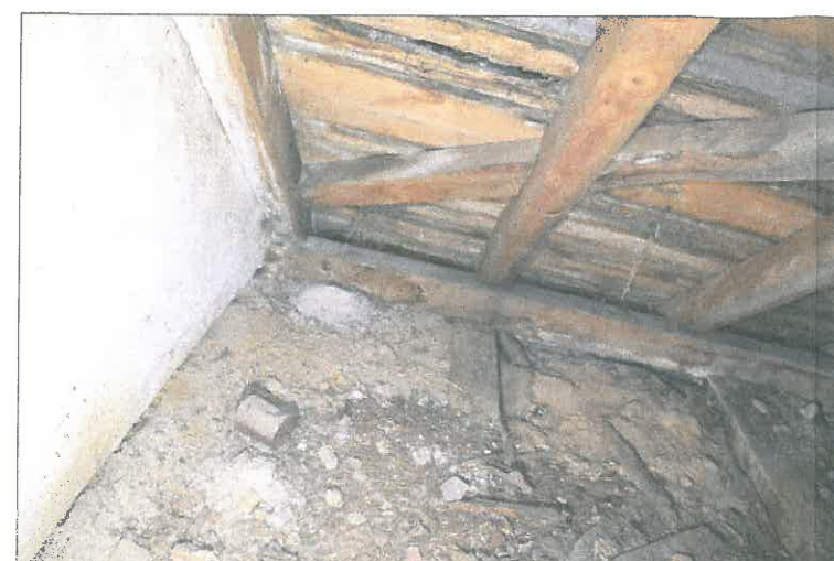
FOT. 11 Wieżba dachowa - prezbiterium.