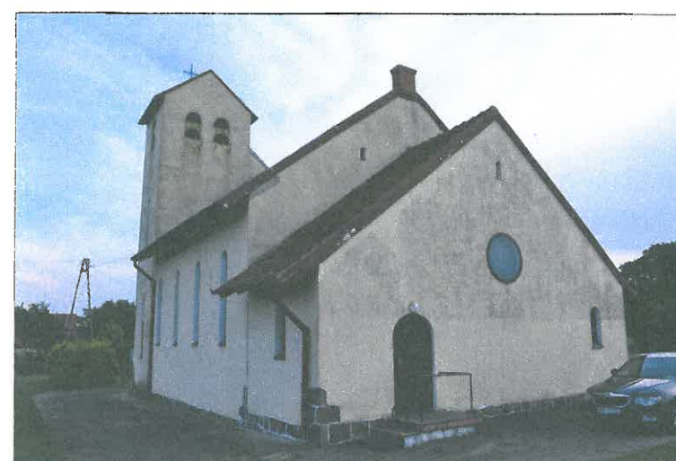
FOT. 4 Elewacja południowa obiektu.