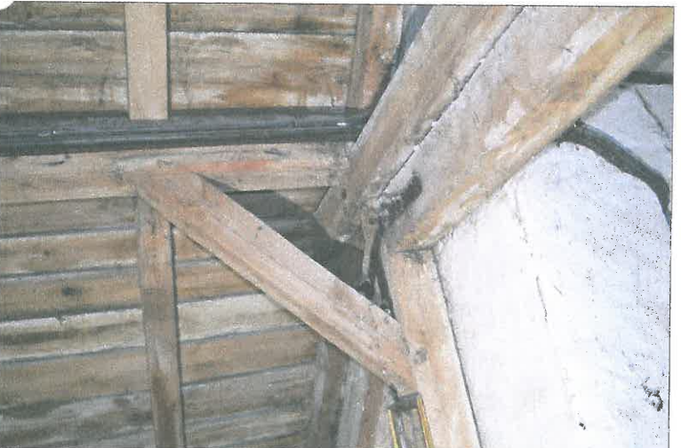
FOT. 24 Więźba dachowa - nawa główna.