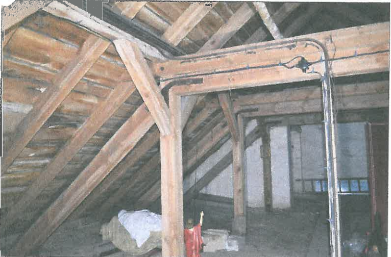
FOT. 21 Więźba dachowa - nawa główna.