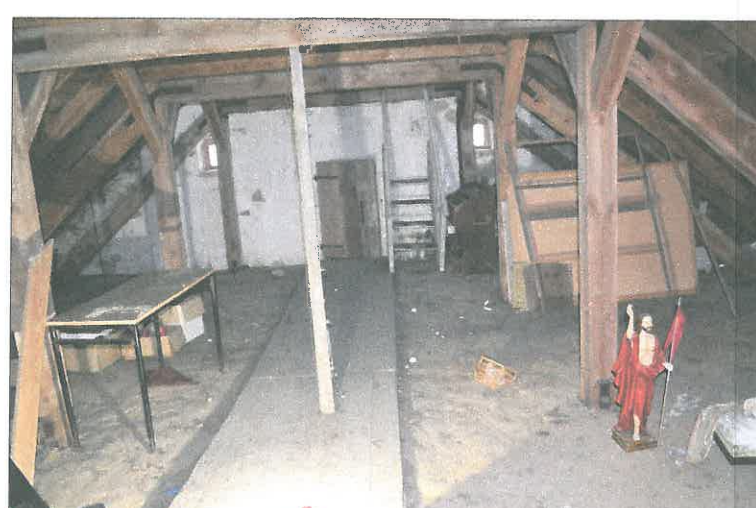
FOT. 17 Wieżba dachowa - nawa główna.