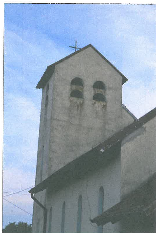
FOT. 2 Elewacja północna obiektu.