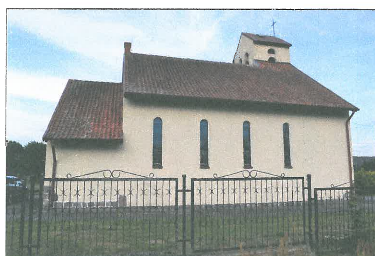
FOT. 6 Elewacja wschodnia obiektu.