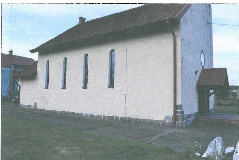
FOT. 7 Elewacja wschodnia obiektu.