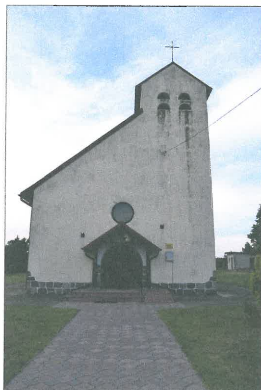
FOT. 1 Elewacja południowa obiektu.