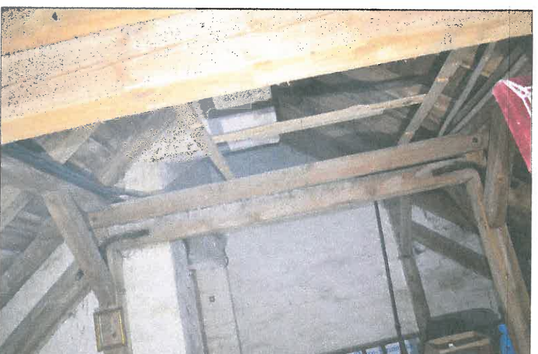
FOT. 23 Więźba dachowa - nawa główna.