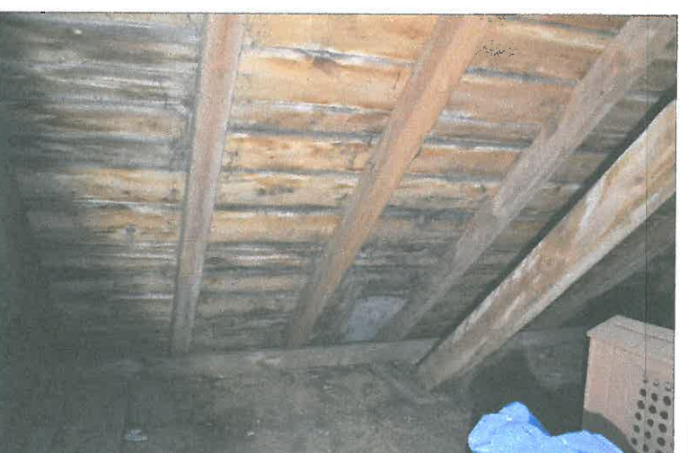
FOT. 26 Więźba dachowa - nawa główna.

Napierki 36 ,13-111 Janowiec Kościelny Jednostka ewidencyjna: Janowiec Kościelny, Obręb: Napierki ,dz. nr 141, obr.geod. nr 0021,