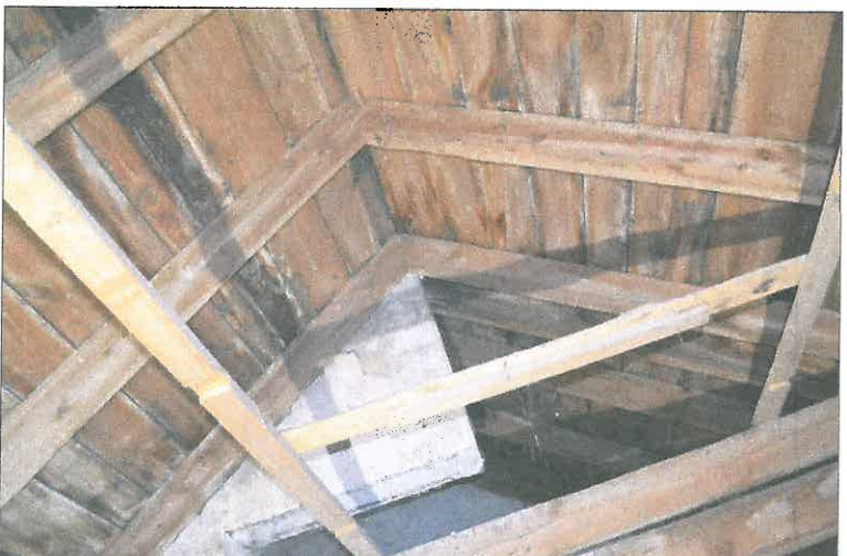
FOT. 22 Więźba dachowa - nawa główna.