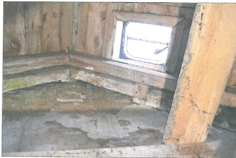
FOT. 18 Więźba dachowa - nawa główna.